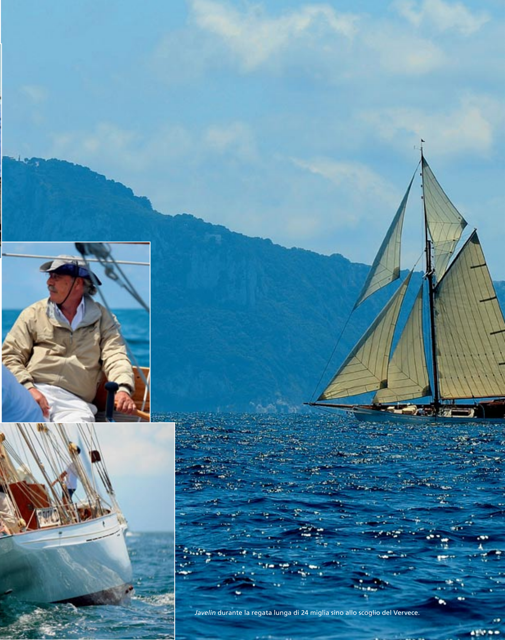
Javelin durante la regata lunga di 24 miglia sino allo scoglio del Vervecce.