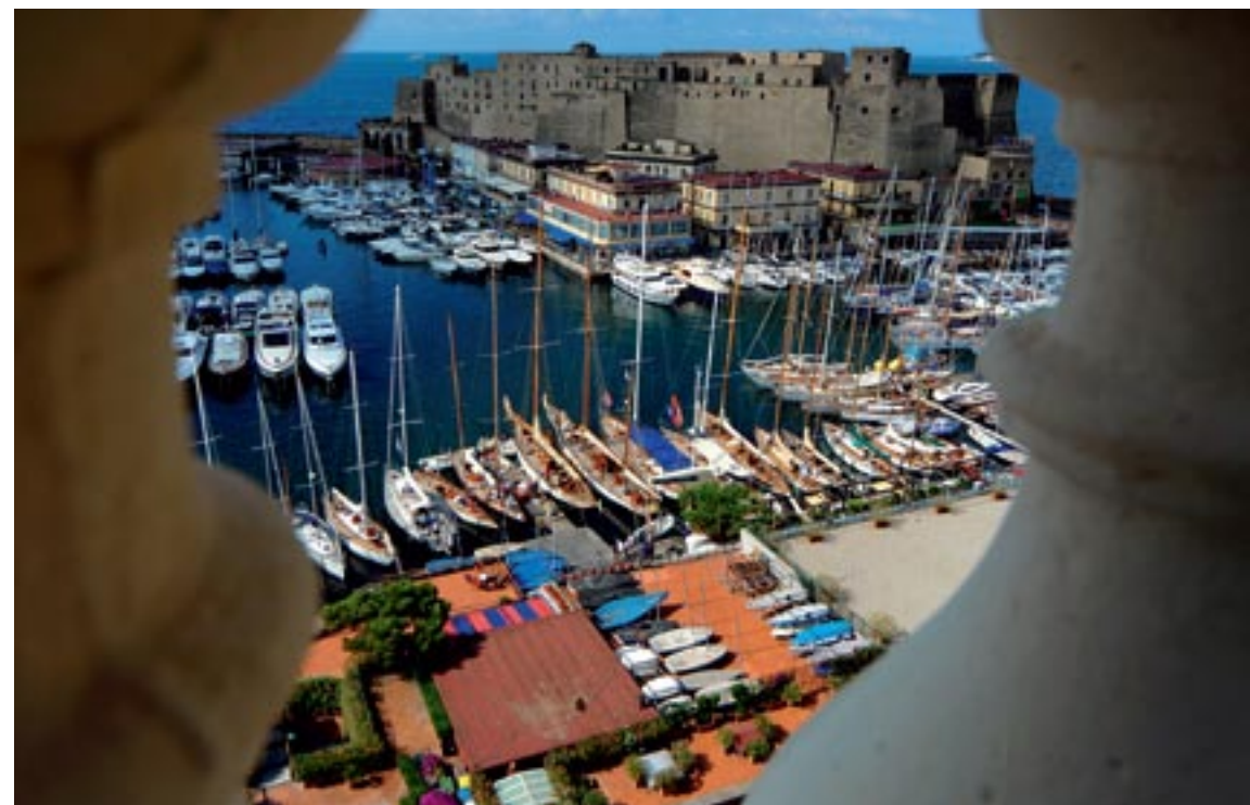
Una veduta dall'hotel Excelsior del Borgo Marinari, con l'imponente Castel dell'Ovo e le barche d'epoca ormeggiate nel porticciolo di Santa Lucia.

con pervicacia accattivante, il mare ha restituito le sue virtù e la composizione di ciascun elemento del Golfo ha avvicinato con coraggio le dame più nobili e ritrose sino a farle innamorare di sé. Cantiamo