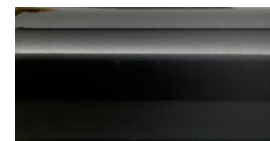
SMALTO NERO BLACK ENAMEL