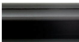
PORCELLANA NERA BLACK PORCELAIN