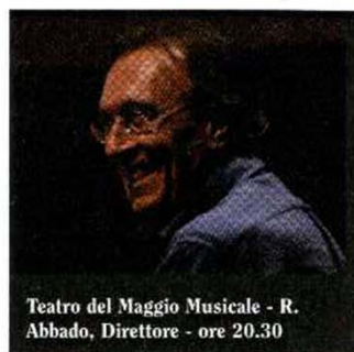
Teatro del Maggio Musicale - R. Abbado, Direttore - ore 20.30

Girogustando - Il Ristorante La Grotta di San Francesco di Siena ospita il Ristorante Margò di Palermo