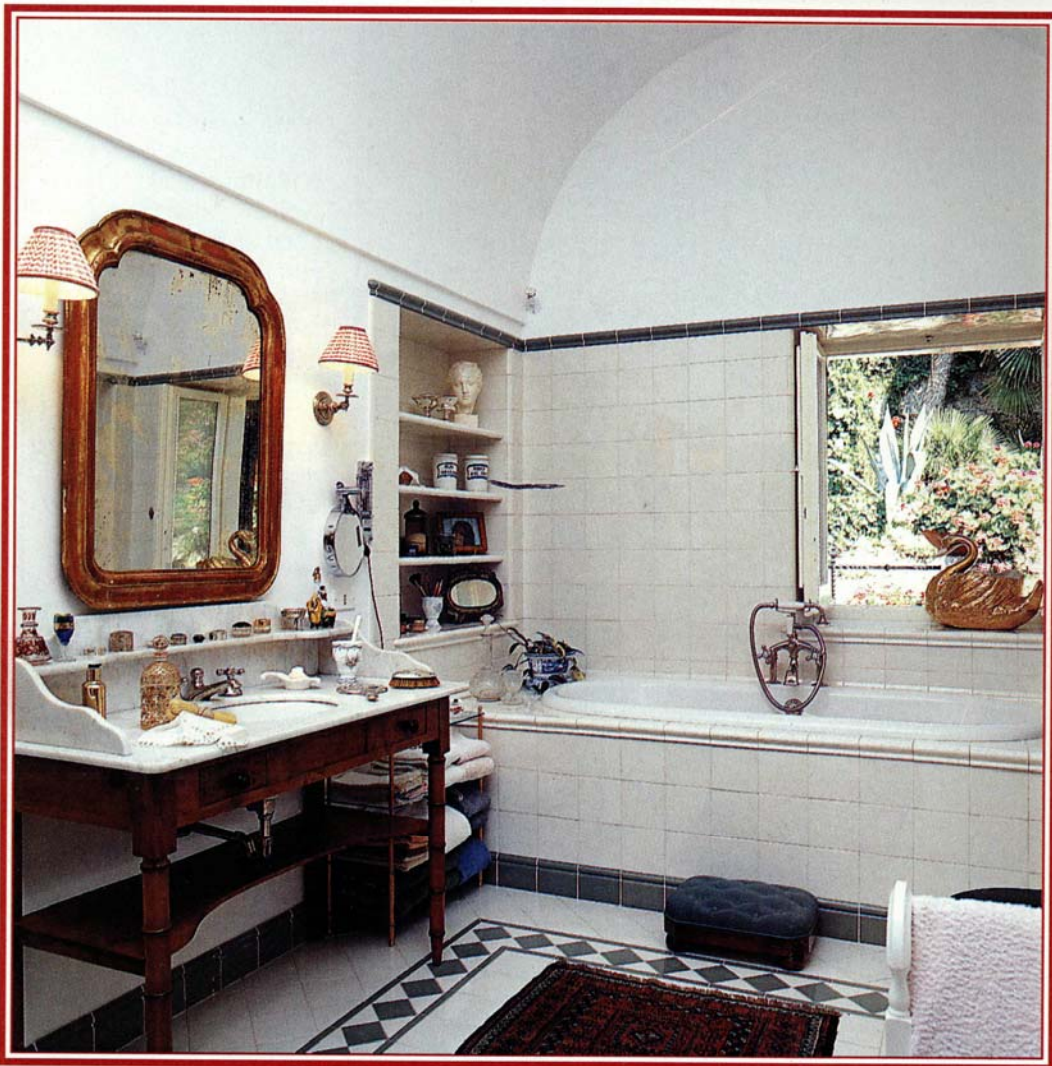
NELLA STANZA DA BAGNO LA PRESENZA DI MAGGIOR PREGIO È LA FINESTRA-QUADRO

Una cornice decorativa e il pavimento acquista subito uno stile «importante»: sotto, due proposte in marmo verde con inserti a mosaico della Deamar. Il formato delle piastrelle può essere di cm 15x30, 30,5x30,5 e 40x40 (da L. 125.000 il pezzo).